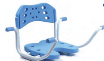
Сиденье для ванны