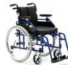
Кресло-коляска с ручным приводом комнатная / прогулочная