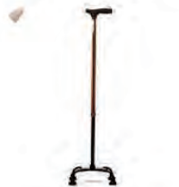
Трость трехопорная, четырехопорная, регулируемая по высоте, с устройством противоскольжения