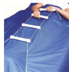
Опора в кровать веревочная (лестница для самоподнимания)