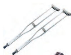
Костыли подмышечные с устройством противоскольжения