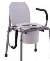
Кресло-стул с санитарным оснащением