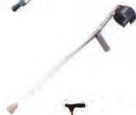
Костыли с опорой под локоть с устройством противоскольжения